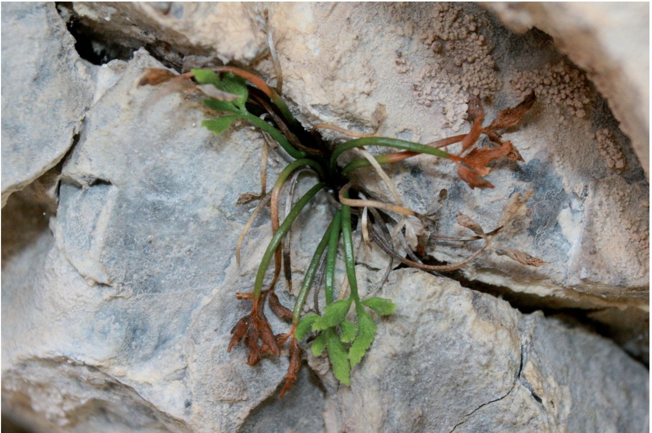
Abb. 1: Asplenium seelosii (Rauchkofel/Lienzer Dolomiten, 2011).