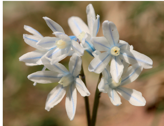
Abb. 5: Puschkinia scilloides (Oberleibnig/Iseltal, 2011).

Oberes Drautal bei Mittewald, Auwaldrand an der Drau, verwildert, ca. 860 m, 9241/2, 2011, obs. OS. – Oberes Drautal bei Thal–Aue nahe Bahnhof Thal, Schlagflur, verwildert,