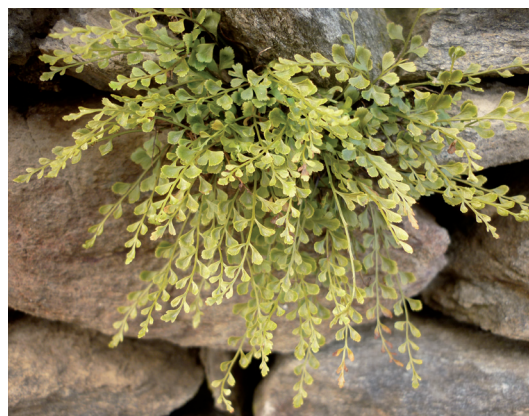
Abb. 2: Asplenium septentrionale subsp. septentrionale × trichomanes subsp. quadrivalens (Patriasdorf/Lienz, 2010).

Lienzer Dolomiten, Frauenbach-Wasserfall bei Lavant, schattige Dolomitfelsen, ca. 670 m, 9243/1, 2011, leg. OS. – Lienzer Dolomiten, unteres Hallebachtal, schattiger Dolomitfels, ca. 900 m, 9242/2, 2011, obs. OS. – Lienzer Dolomiten, Spitzenstein, Dolomitfels, ca. 2150 m, 9241/4, 2011, leg. OS. – Neu für Osttirol. Über das Vorkommen der Unterarten und Hybriden von Asplenium trichomanes in Salzburg hat STÖHR (2010) erst kürzlich berichtet. Nun folgen für die subsp. hastatum die längst überfälligen Erstfunde für die Lienzer Dolomiten und damit für ganz Osttirol. Bei POLATSCHKE (1997) ist diese Unterart für Tirol trotz alter Angaben gar