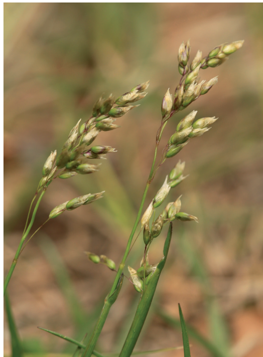
Abb. 3: Hierochloë odorata (Tristacher See/Lienzer Dolomiten, 2011).

Drautal S Lienz, Kreuzeckgruppe, Gehöft Grasegger nahe Lengberg, Weiderasen, ca. 715 m, 9143/3, 2011, leg. OS.