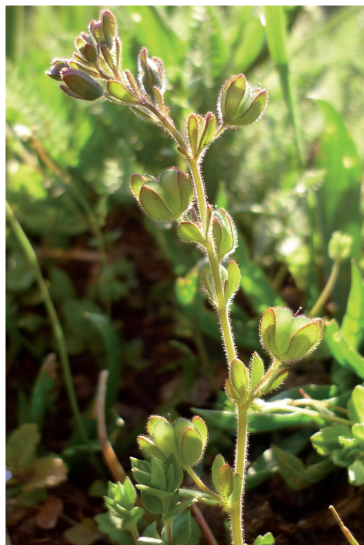
Abb. 6: Veronica triphyllos (Nußdorf/Lienzer Talboden 2011, Foto: Oliver Stöhr).

Iseltal bei Oberlienz, Magerwiese bei der Glanzer Iselbrücke, ca. 700 m, 9142/1, 2010, obs. OS. – Diese wärmeliebende Art scheint in Osttirol nach POLATSCHKE (2001) und eigenen Beobachtungen nur auf die wärmebegünstigten Talbereiche beschränkt zu sein, sie dürfte zudem aufgrund des auch in Osttirol zunehmenden Verlustes an Magergrünland bereits sehr selten und hochgradig bedroht sein. Der obige Fund ist eine Ergänzung zu den spärlichen bei POLATSCHKE (2001) genannten Nachweisen; beobachtet wurde in Oberlienz nur eine kleine Population im Bereich eines kleinflächigen Magerwiesenrestes.